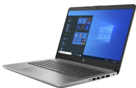
Modèle HP 245 G8

Si votre système Windows est bloqué, instable, ou pose anormalement problème avec des logiciels, la Région Grand-Est a fourni avec ses PC une assistance pour tout souci logiciel. Vous pouvez joindre cette assistance technique au numéro suivant :