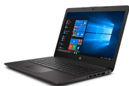
Modèle HP 240 G7

Mon PC date de septembre 2021 03 67 70 74 56